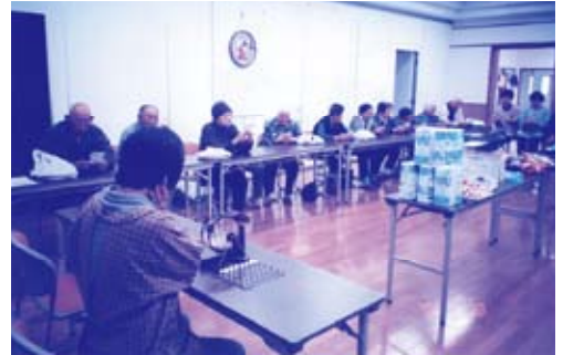
ビンゴゲームに皆真剣

わかってきています。その間スタッフの皆さんには、多くの協力をいただきお世話になってきました。