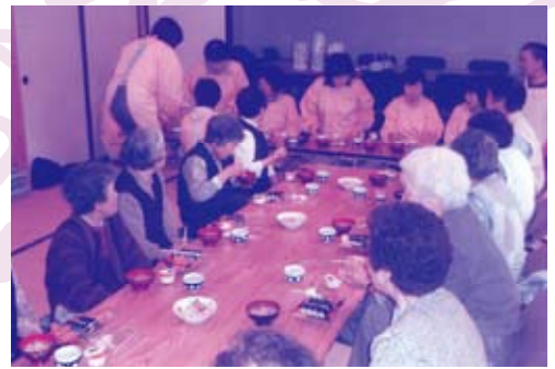
ボランティアの手作りで食事