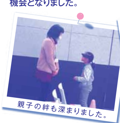
親子の絆も深まりました。