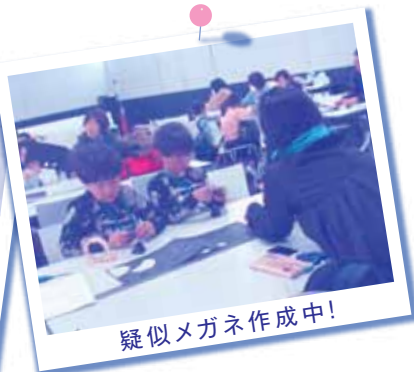
疑似メガネ作成中!