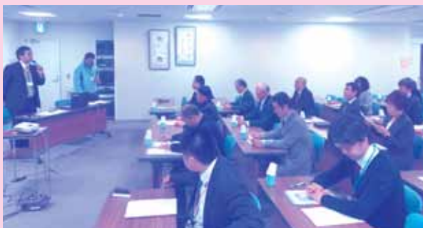
▲静岡市元氣いきいき!シニアサポーター事業視察研修 於：静岡市清水社会福祉会館「はーとびあ清水」

さらに、平成29年度は、市内6地区で、地域福祉推進委員会を基盤とする「第2層生活支援・介護予防協議体」が発足します。今後も「第1層・第2層生活支援・介護予防協議体」、「生活支援コーディネーター」が、連携を密にし、当市の高齢者生活支援体制整備を図ります。