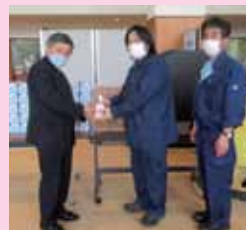
有限会社東富士クリーンサービス様