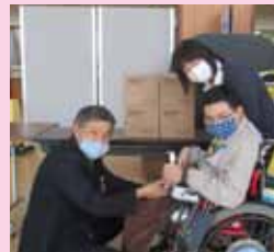
肢体不自由児(者)父母の会様へお渡ししました。