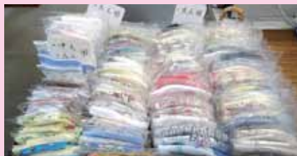
和装連盟様からの手作りマスク