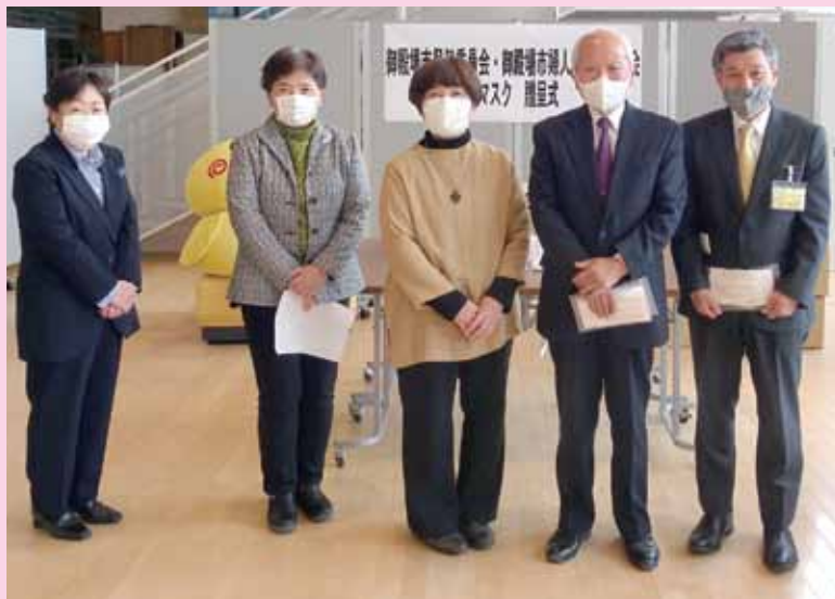
御殿場市保健委員会様・御殿場市婦人会連絡協議会様