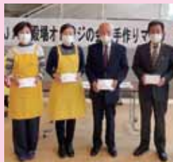
JA御殿場オレンジの会様