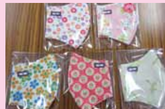
市民の方からの手作りマスク