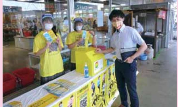
街頭募金活動の様子