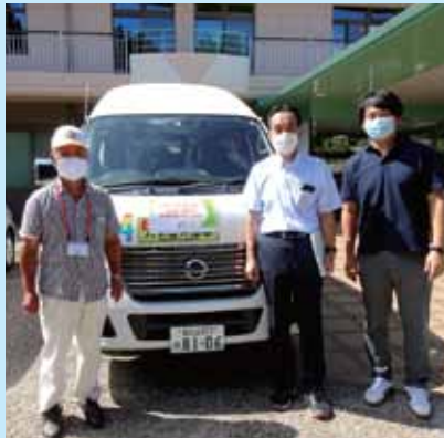
(福)十字の園御殿場十字の園の福祉車両