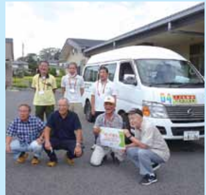
北久原区の皆さん