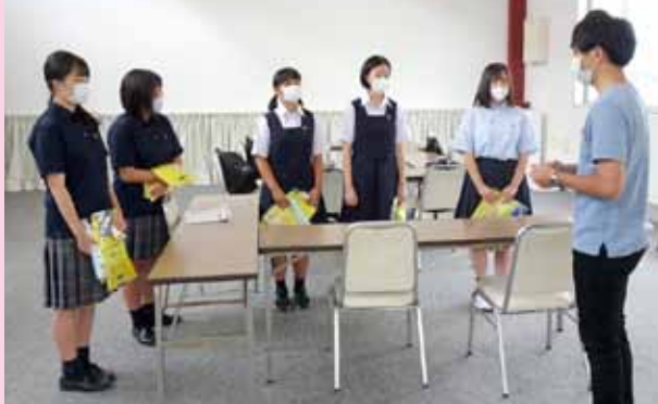
静岡第一テレビからの詳細説明