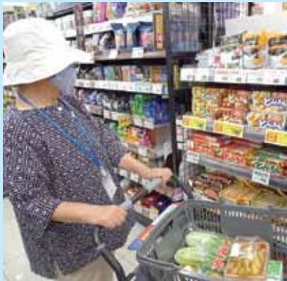
たくさん買うわよ!

当日の利用者は3人、(福)十字の園御殿場十字の園の福祉車両を地域の運転ボランティアが運転し、マックスバリュ萩原店まで送迎しました。買い物を終えた利用者からは、「自宅前まで送ってくれるので、たくさん買える物ができた」「自分の目で商品を選べるのが嬉しい」「また利用したい」などの声を聞くことができました。