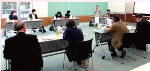
▲インストラクターからはいつもの確かな助言が…