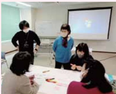
参加者によるグループワークの様子 ▶