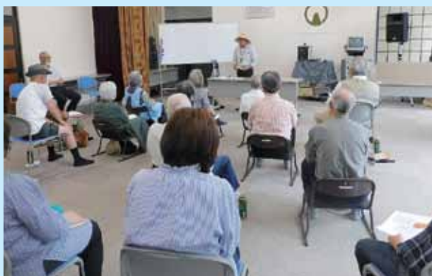
小木原区は楽しいマジックショーを鑑賞

それぞれの特色をいかながら、区長さん、民生児童委員さんも参加する賑やかな集いとなりました。