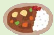
カレーの無料提供がありました。