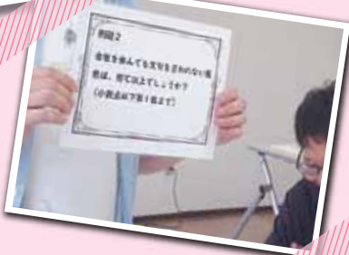
クイズいいせんいきましよう