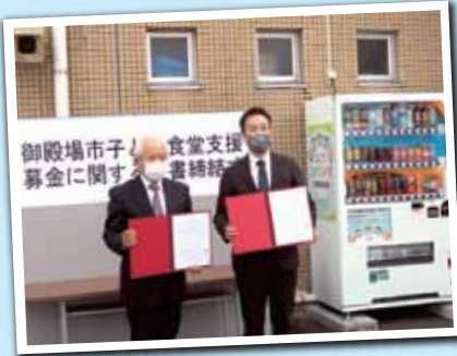
令和4年3月の覚書締結式と第1号機お披露目式の様子

子ども食堂が増えている現在、「子ども食堂支援自動販売機」は、子ども食堂をまち全体で後押しするという重要な役割を担っています。