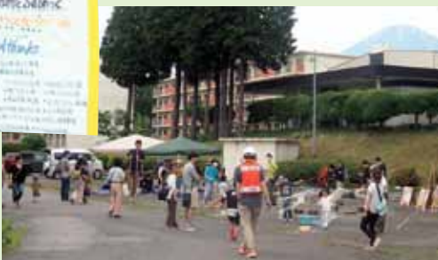
親子が楽しいひとときを過ごせる場を提供