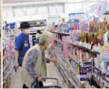
ウエルシア御殿場西店内