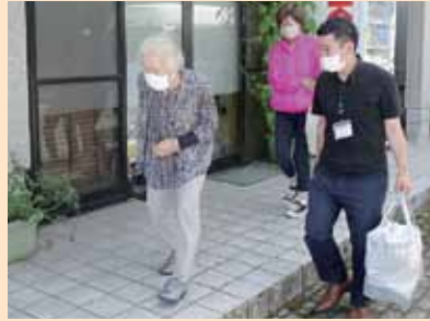
運転して重い荷物を運んでくれる高根施設長

★普段、買い物は若い衆がしてくれる。でも自分の食べたい物を自分の目で見て買いたいと思っていました。楽しかったのでまた利用します！