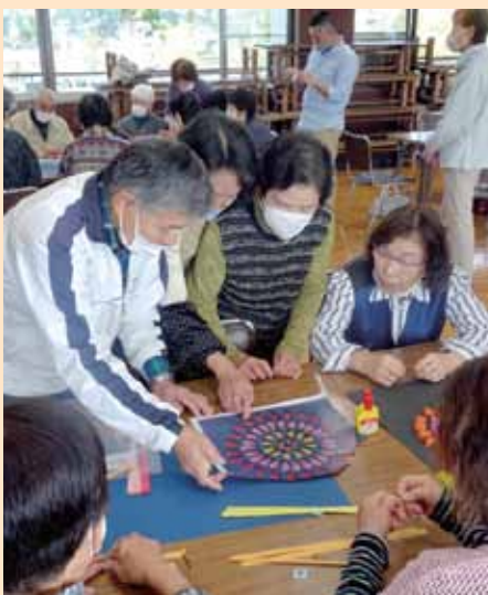
今年はペーパークイリングに挑戦

山之尻では、このほか地域包括支援センター職員による体操やゲーム、役員が企画した輪投げやベタボードなど年3回サロンを開催しています。