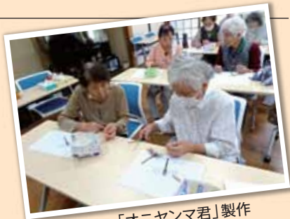
「オニヤンマ君」製作