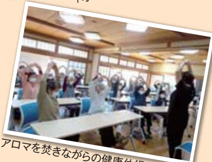
アロマを焚きながらの健康体操

アロマの香り広がる空間に心も癒されます。健康体操や脳トレ、製作体験を中心に、スタッフ、参加者共に楽しそうな声が響き、笑顔広がる居場所です。皆さん笑顔で元気に手を振って帰る姿が印象的です。