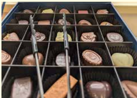
「甘いものは好きですか？」